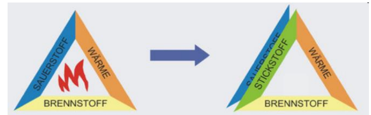
Brandvermeidung durch z.B. Sauerstoffreduktion

Gaslöschanlagen (z.B. CO-2, ARGON, NOVEC)